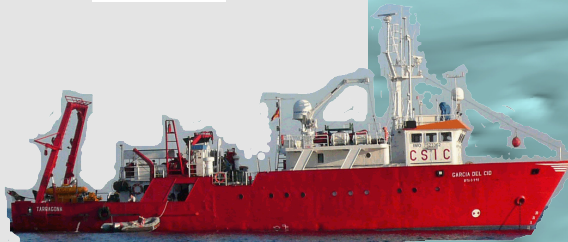
VAIXELL OCEANOGRÀFIC GARCÍA DEL CID (CSIC)